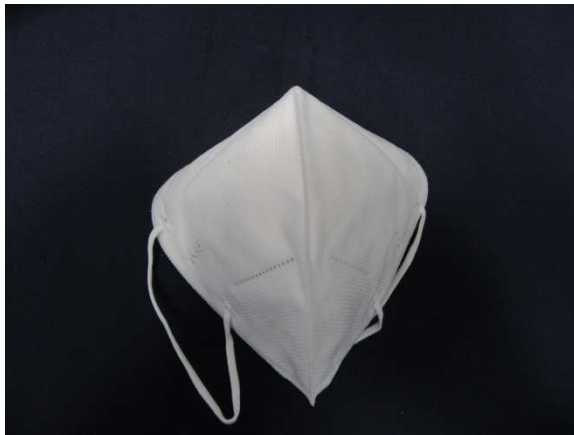
Frontansicht / front view