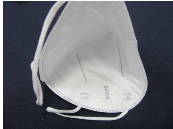
Innenansicht / inner view