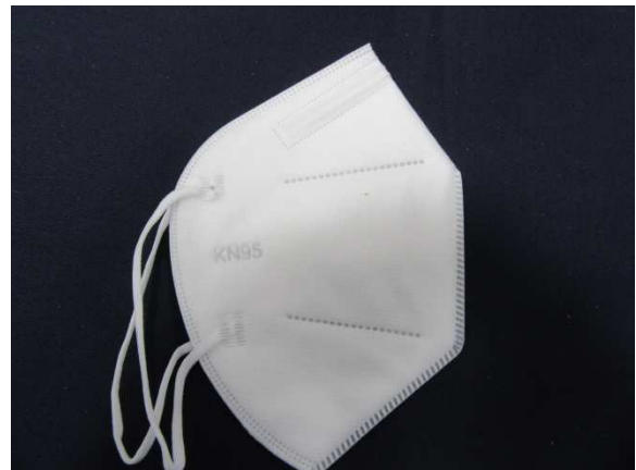
Seitenansicht rechts / side view right