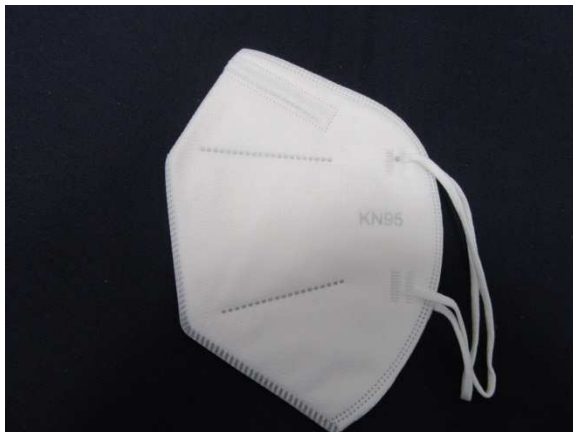
Seitenansicht links / side view left