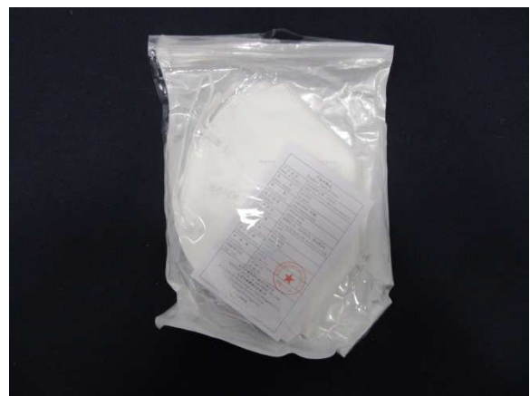
Verpackung / packaging